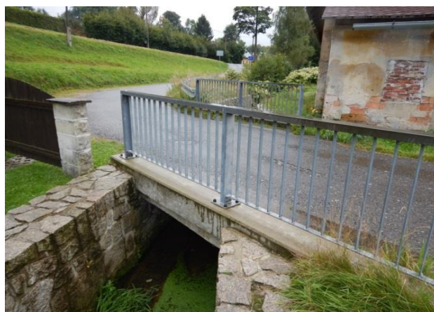
Kritický bod - mostek