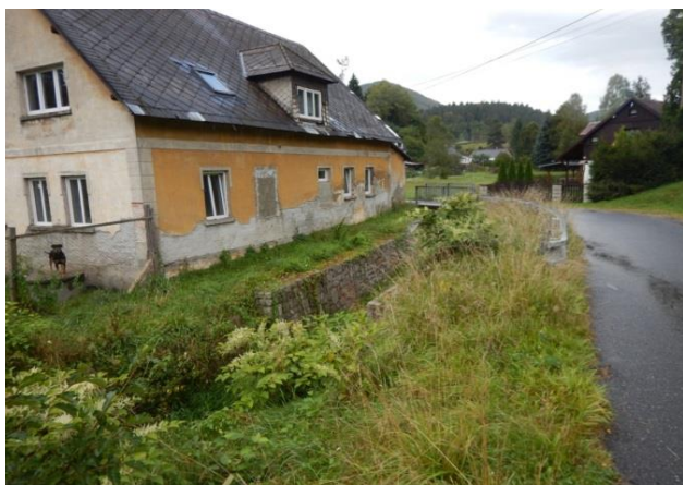
Zástavba u kritického bodu

Ohrožení na jednom z mostků přes Luční potok v nesouvislé zástavbě v Oldřichově v Hájích.